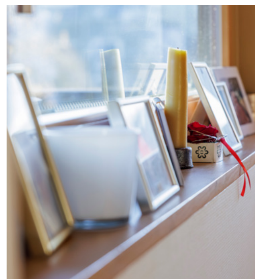
Einzelzimmer mit eigener Nasszelle